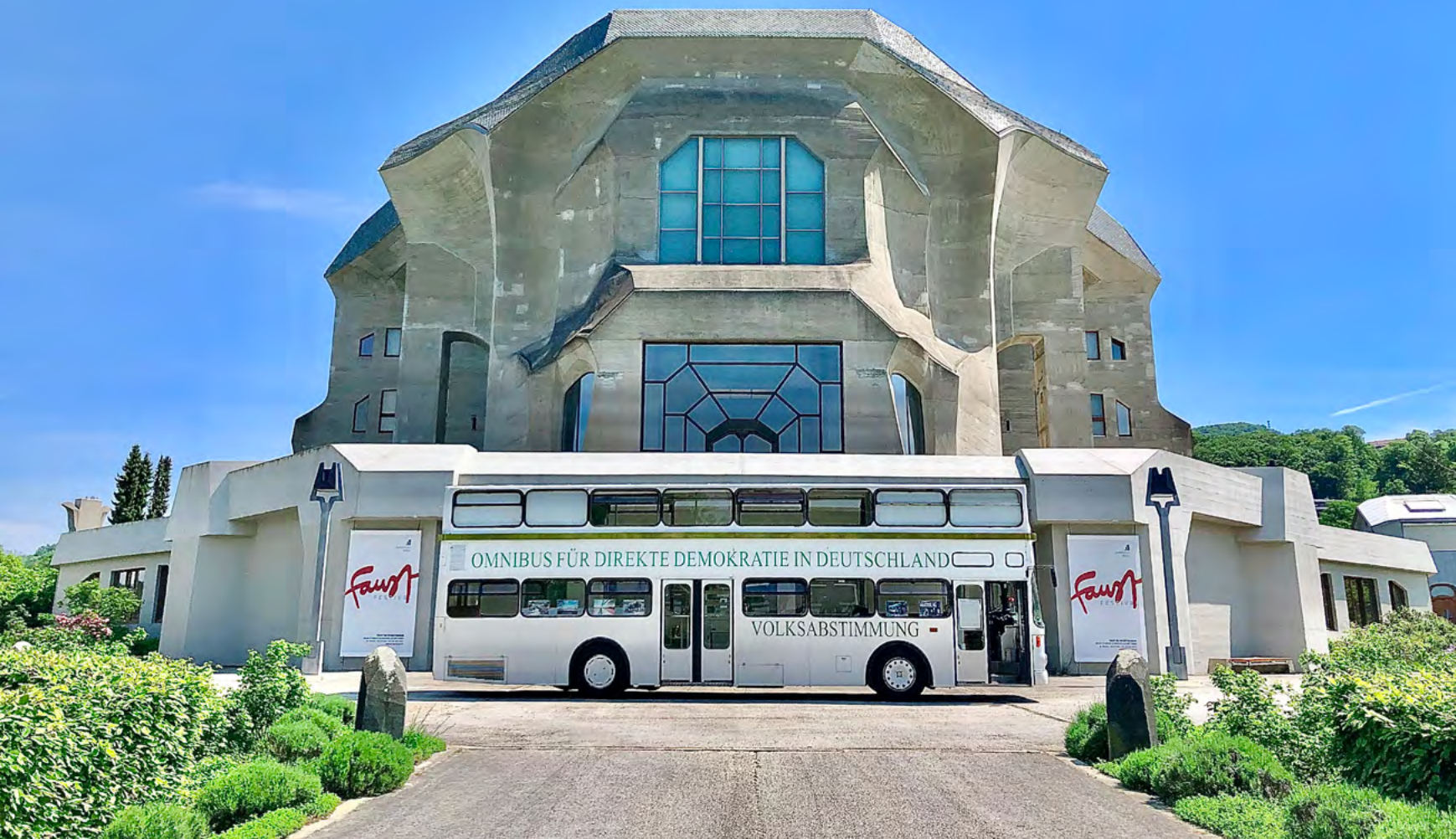
Der Omnibus für direkte Demokratie vor dem Goetheanum, Foto: Z. v. G.

KÜPPERS Ja, genau. Und da sind unendliche Geduld und Bescheidenheit angesagt. Das Ganze ist wie eine immerwährende Schule.