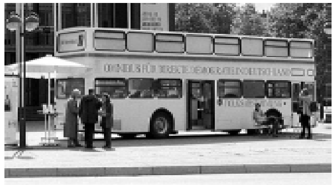
Der Omnibus für Direkte Demokratie ist ständig unterwegs, von Stadt zu Stadt.

Es ist wichtig, sich immer wieder diese weitere Perspektive zu vergegenwärtigen. Viele Menschen sind ungeduldig und demotiviert, wenn es nicht schnell geht. Die Volksabstimmung ist aber die Erdung des Sozialen Ganzen in sich selbst. Das