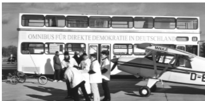
Der Omnibus, das Flugzeug und das Fahrrad für Direkte Demokratie beim Volksbegehren „Mehr Demokratie in Thüringen“ im November 2000.

Mit dem Omnibus informieren und sprechen wir über die bundesweite Volksabstimmung - jeden Tag bei Sonne und bei Regen, von Ort zu Ort. Wir sammeln Unterschriften und Fotos von Menschen, die sich für die Volksabstimmung aussprechen. Diese wandernde Fotoausstellung wird dann vor dem Berliner Reichstag in einer großen Aktion präsentiert.