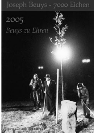
2005 Beuys zu Ehren Aktionskünstler Beuys: Nur wenige polarisierten so wie er (Kalender Deckblatt zur Kunstaktion „7000 Eichen“)

Solcherart entstehe ein realer Bildungsvorgang durch Mitbestimmung, durch dessen imaginativen Anteil sich, unabhängig vom Ausgang der Abstimmung, die geistige Situation im Lande verbessern kann. Würden heranwachsende Menschen auf diese Möglichkeit der Gesellschaftsbildung nicht nur theoretisch, sondern mittels praktischer Erfahrung im Lernumfeld vorbereitet, dann könne die Bildungskrise dank der direkt-demokratischen Möglichkeiten, wie sie im kommunalen Bereich und auf Länderebene gesetzlich verankert sind, von ihrer Wurzel her angegangen werden. Den Zusammenhang zwischen Volksgesetzgebung und der Imagination respektive der Idee durch erweitertes Denken will Beuys ganz bewusst eingesetzt wissen, denn wo das Denken wieder den Anschluss an die Ideenebene findet, kann die Kunst kraft der Kreativität des Einzelnen in das Feld der menschlichen Zusammenarbeit erweitert werden.